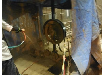
パレル ワイヤソー切断工