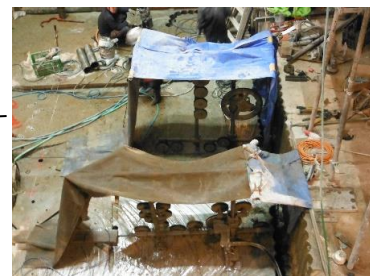
地下ケーシング ワイヤソー切断工