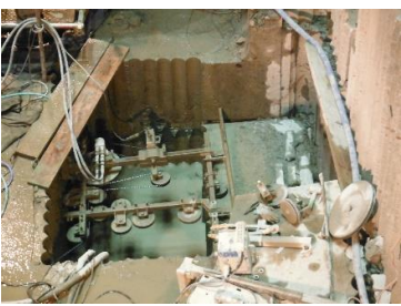
ケーシング ワイヤソー切断工