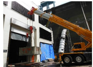
クレーン外部吊出し