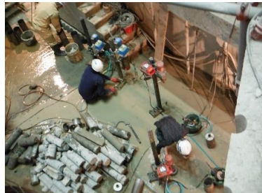
ケーシング コア穿孔工