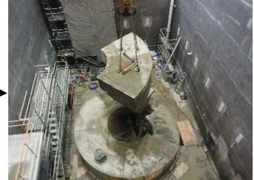
パレル クレーン撤去工