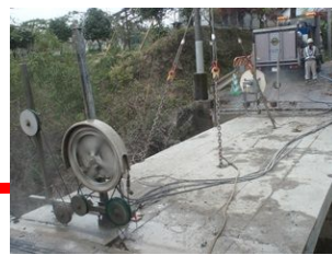
ワイヤーソー切断工