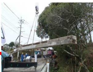
切断ブロック吊り撤去工