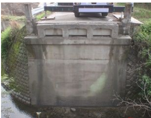
切断ブロック吊り撤去完了