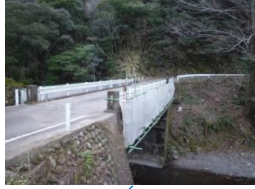
仮設工 吊り足場組立完了