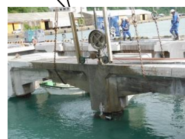
ワイヤー杭頭切断状況