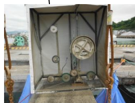
ワイヤー梁切断状況