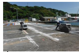
床板カッター切断状況