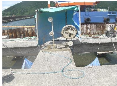
ワイヤーソー切断