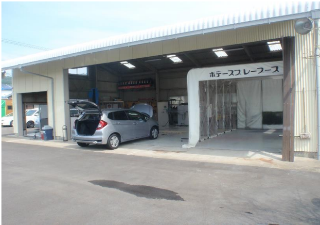
作業場(整備・板金・塗装)