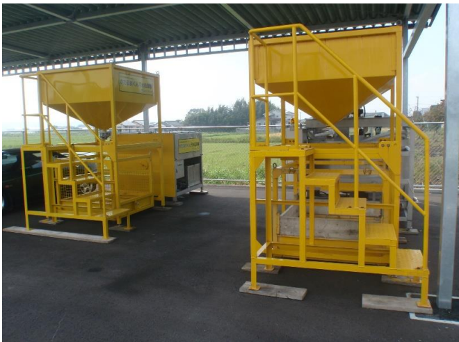
汚水処理機等展示場